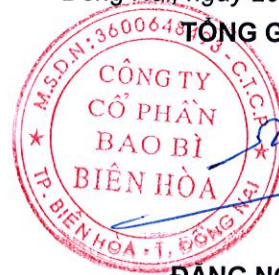
ĐẶNG NGỌC DIỆP